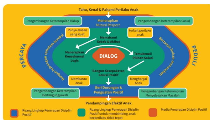
Gambar 3 Skema Penerapan Disiplin Positif

Konsep disiplin positif yang ditemukan, baik pada kajian literatur maupun dalam panduan implementasi Kurikulum Merdeka mensyaratkan perlunya komunikasi efektif. Dalam Panduan Disiplin Positif untuk Merdeka Belajar (Souisa dkk., 2022), ditegaskan bahwa inti dari siklus pembelajaran melalui penerapan disiplin positif adalah membangun dialog, seperti pada Gambar 3.